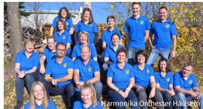
Harmonika Orchester Häusern

14 Uhr Kraftwerksbesichtigung im Wasserkraftwerk Schwarzabruck mit Tonbildschau und Führung. Treffpunkt: Pforte Kraftwerk.