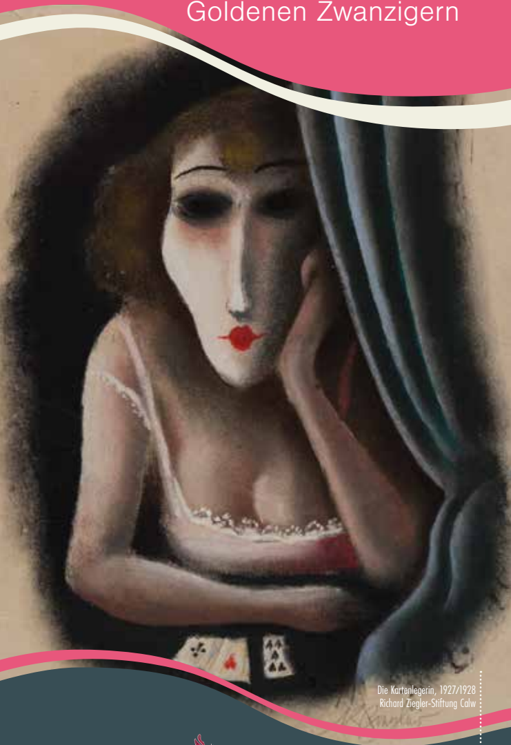
Die Kartenlegerin, 1927/1928 Richard Ziegler-Stiftung Calw

Lust und Leiden in den Goldenen Zwanzigern