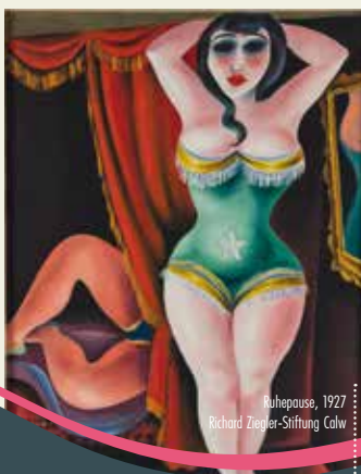
Ruhepause, 1927 Richard Ziegler-Stiftung Calw