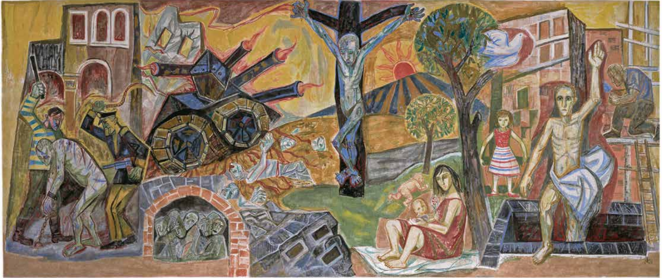
Otto Dix, Krieg und Frieden, 1960 Keimsche Mineralfarben Technik A (nach Kurt Wehlte) auf Silikatputz Rathaus Singen (Hohentwiel), Ratssaal

Das einzig erhaltene, monumentale Wandbild von Otto Dix findet sich in Singen am Hohentwiel.