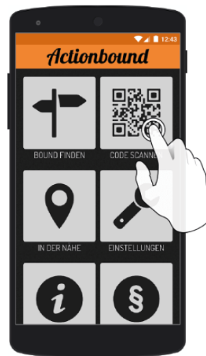
Actionbound-App in App Store oder Google Play kostenlos herunterladen