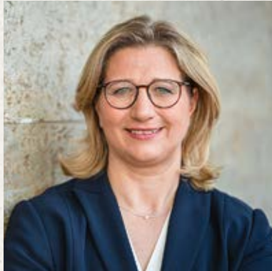
ANKE REHLINGER – MINISTERPRÄSIDENTIN DES SAARLANDES UND SCHIRMHERRIN DES HOFFESTES 2022

— LIEBE BESUCHER*INNEN DES HOFFESTES 2022 —