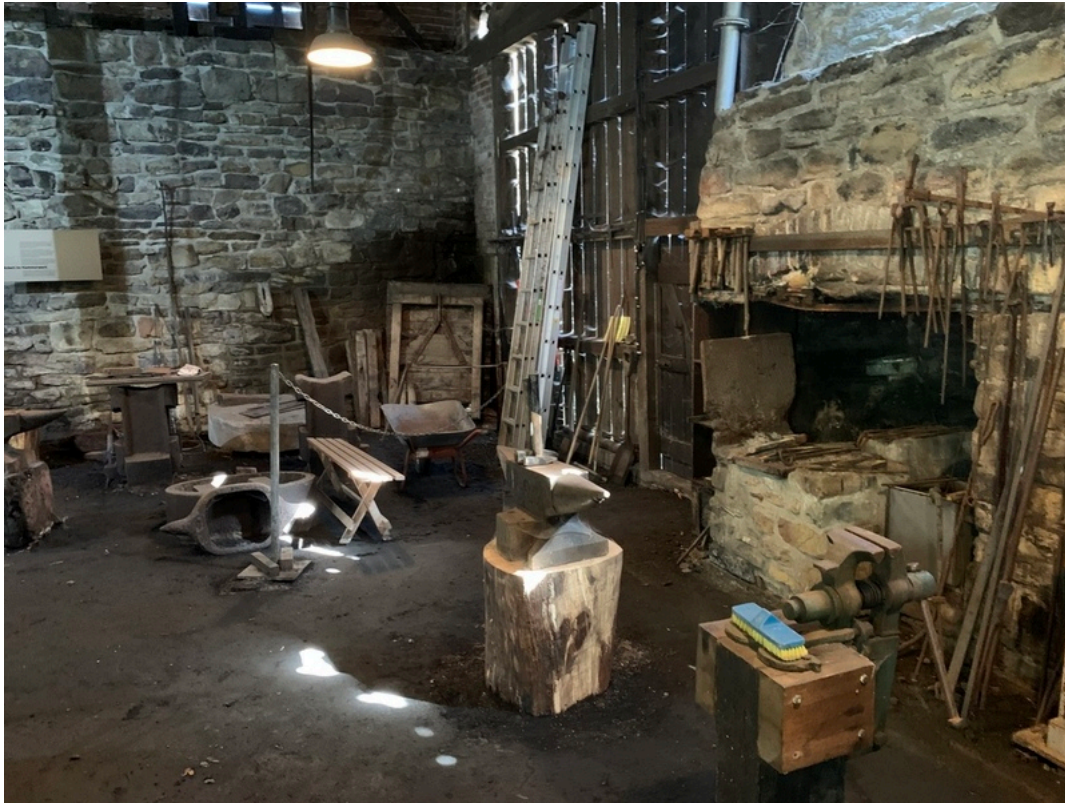
LVR-Industriemuseum Kraftwerk Ermen & Engels