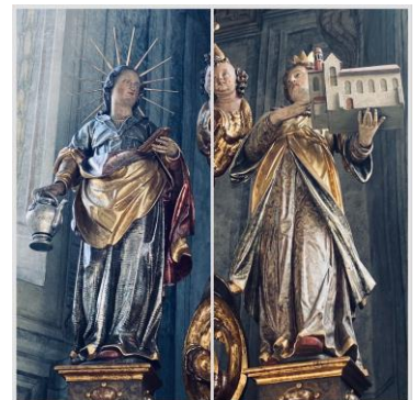
Das Innere der Kapelle kann bei Stadtführungen oder bei Kirchenanlässen besichtigt werden.