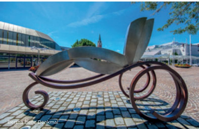
Bertha Benz Denkmal

Die weithin sichtbare Kuppe des Wallbergs ist aus Trümmern und Bauschutt des zweiten Weltkriegs aufgeschüttet. Die Erinnerungsstelen mahnen zum Frieden und zur Ablehnung des Krieges zur Durchsetzung politischer Ziele. Sie erinnern auch an die Aufbauleistung nach der totalen Zerstörung der Stadt als Beispiel zur Überwindung der damaligen Krise.