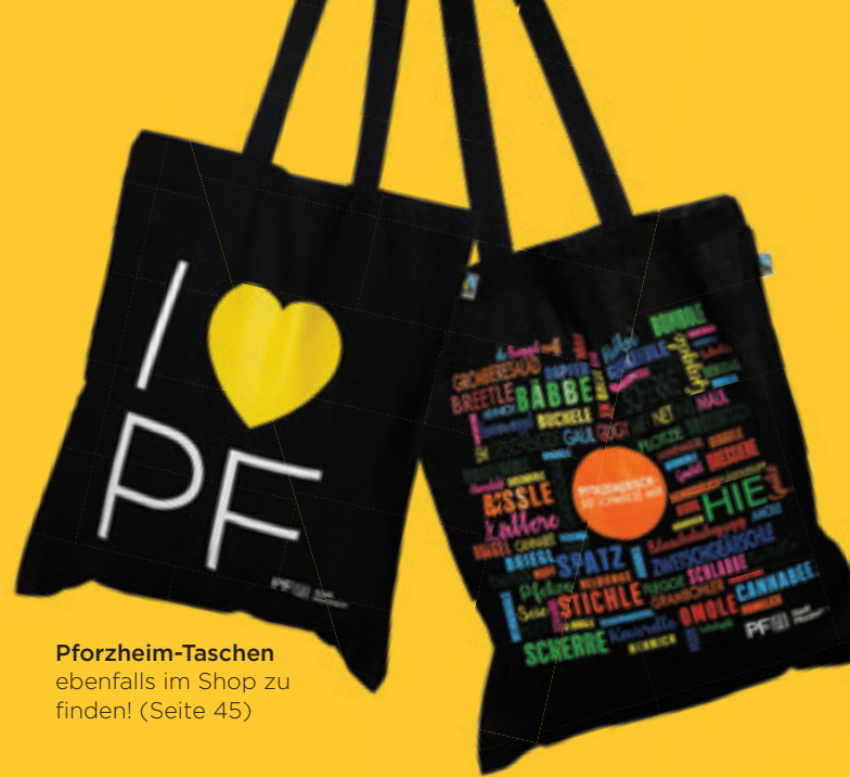
Pforzheim-Taschen ebenfalls im Shop zu finden! (Seite 45)