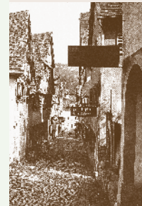
Die Metzgergasse, die zum Armenasyl auf dem Schießberg hochführte.

Tief unterhalb der Burgruine Zavelstein fließt die Teinach, die zu Hermann Hesses Jugendzeit noch etliche Mühlen und Sägen antrieb. Eine davon, die noch heute existiert, ist der Schauplatz von einer der dramatischsten Liebesgeschichten Hesses. Der Erzähler, ein in der Gegend seine Ferien verbringender Student, verliebt sich in der dortigen Marmorsäge in die schöne Tochter des Hauses, die jedoch von Geheimnissen umgeben ist.