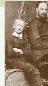
Hermann Hesse 12-jährig mit seinem Vater.

Auf dem Schießberg, wo heute das Hesse-Gymnasium steht, stand im 19. Jahrhundert das Calwer Armenasyl. Hermann Hesse imaginiert in seiner 1904 geschriebenen Erzählung, die ein Publikumserfolg wurde, humorvoll die Eröffnung dieses Asyls durch den Einzug zweier Männer, die auf verschiedene Weise im Leben gescheitert sind und nun in einem Zweikampf die letzten Reste ihrer Würde zu retten versuchen.