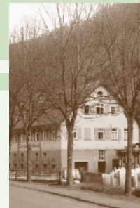
Die Marmorsäge im Teinachtal.

Den Stoff zu den drei Erzählungen, die gelesen werden, hat Hermann Hesse auf ganz verschiedene Weise bekommen: durch Beobachtung eines Eigenbrötlers, der in der Nachbarschaft seines elterlichen Hauses wohnte, durch eigene Erfahrung bei seinem Mechanikerpraktikum bei Perrot 1894/95, und durch die Erzählung eines Freundes, der in einer anderen Werkstatt praktizierte und dort Zeuge eines spannenden Konfliktes wurde.