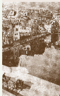
Blick von der Nikolausbrücke auf das Nagoldwehr mit der Werkstatt, in der Hermann Hesse sein Mechanikerpraktikum absolvierte.

Hermann Hesse hat in seiner Gaienhofener Zeit, als er immer wieder unter seiner Sesshaftigkeit litt, einen Vagabunden namens Knulp erschaffen. Als Geburts- und Heimatort gab er ihm ein Städtchen, das unschwer als Hesses eigenes zu erkennen ist. In dieses lässt er Knulp immer wieder von seinen Wanderungen zurückkehren, um dort alte Bekannte zu besuchen und das Thema von Sesshaftigkeit und Vagabundentum durchzuspielen.