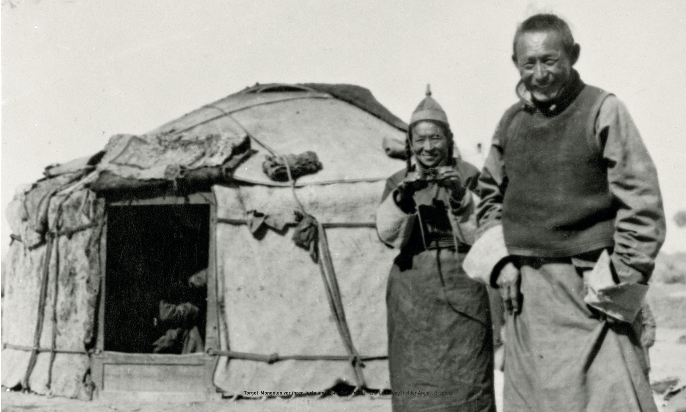
Torgot-Mongolen vor ihrer Jurte am Gobi-Gol.

Zitat: Fritz Mühlenweg In geheimer Mission durch die Wüste Gobi