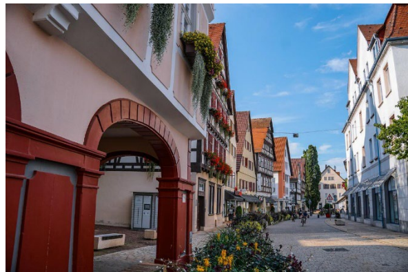
Altstadt der Kleinstadtperle Nagold