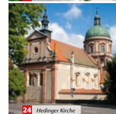
24 Hedinger Kirche