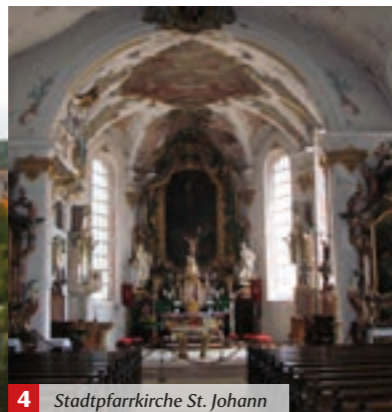
4 Stadtpfarrkirche St. Johann