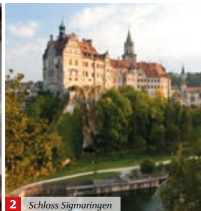
2 Schloss Sigmaringen