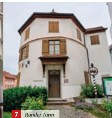
7 Runder Turm