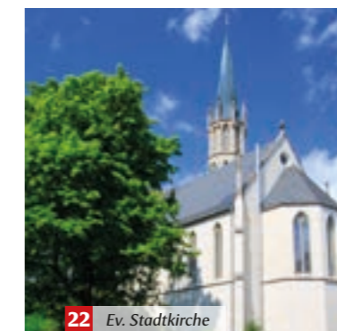
22 Ev. Stadtkirche