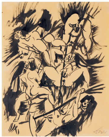
Walpurgisnacht, 1914, Tuschpinsel- und feder