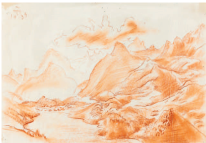
Gebirge und See (Engadin), 1935, Röteli

Sonntage im Kunstmuseum Öffentliche Führung jeweils um 14:30 Uhr Prosecco-Sonntag – das prickelnde Kunstgespräch jeden 1. Sonntag im Monat um 14:30 Uhr Kuchen-Sonntag jeden 3. Sonntag im Monat im Forum ab 13 Uhr