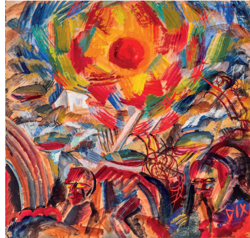
Abendsonne (Ypern), 1918, Gouache über Bleistift

Teil I Alpha 14.3. ▶ 12.10.2025 | Teil II Omega 27.6.2025 ▶ 18.1.2026