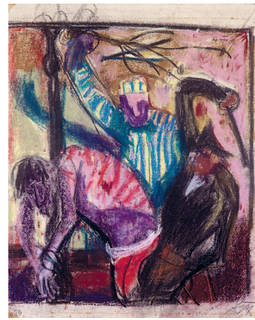
Geißelung II, 1948, Pastellkreide