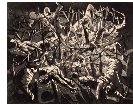
Totentanz anno 17, 1924, aus dem Zyklus Der Krieg , Aquatinta, Ätzzradierung und Kältnadel, Probedruck