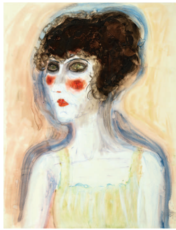
Dirne mit roten Backen, 1923, Aquarell und violetter Farbstift