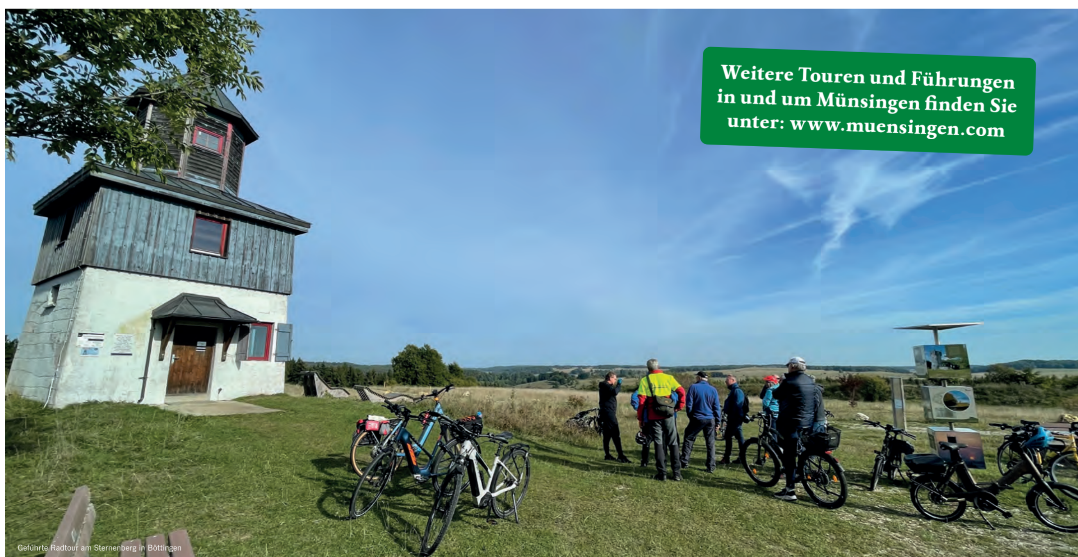
Geführte Radtour am Sternberg in Böttingen