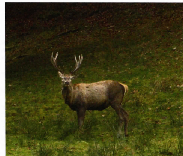
Rotwild im Zeller Wildgehege