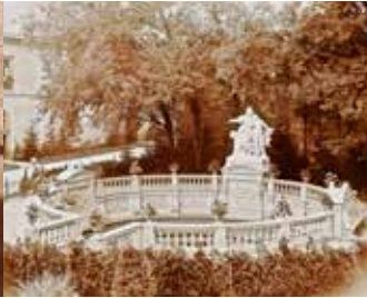
Donauquelle nach 1896

Die historische Bedeutung der Donauquelle in Donaueschingen wird in zahlreichen Quellen ersichtlich, die bis in die römische Antike zurückreichen.