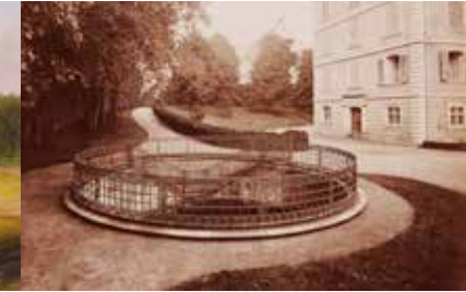
Donauquelle nach 1828