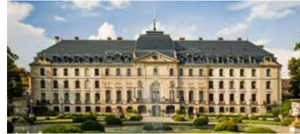
Fürstlich Fürstenbergisches Schloss