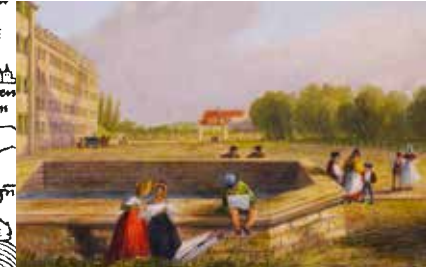
Donauquelle vor 1821