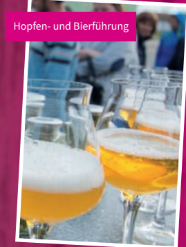
Hopfen- und Bierführung