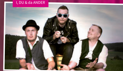
I, DU & da ANDER